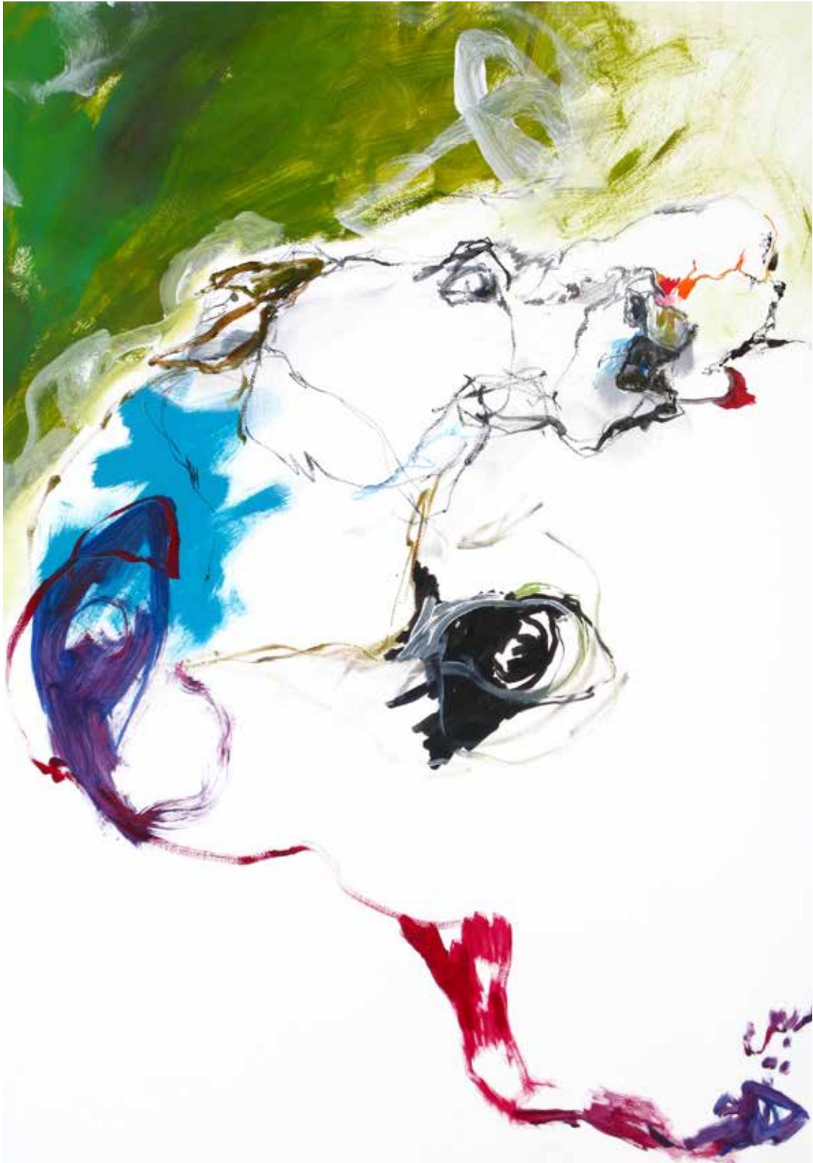
Couleur 1- 2022 © Cécile Baërd