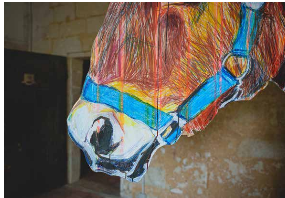
Alfonse, Paul et les autres, Natural leadership, installation (détail - vue d'atelier), dimensions variables, techniques mixtes, Abbaye de Fontevraud, 2022.