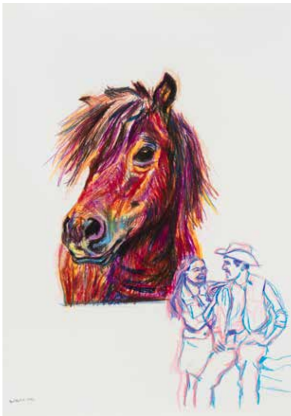
Alfonse, Paul et les autres (attribué à Paul Martin), Sans titre, série Stable things, 65 x 50 cm, crayon de couleur sur papier, 2022.