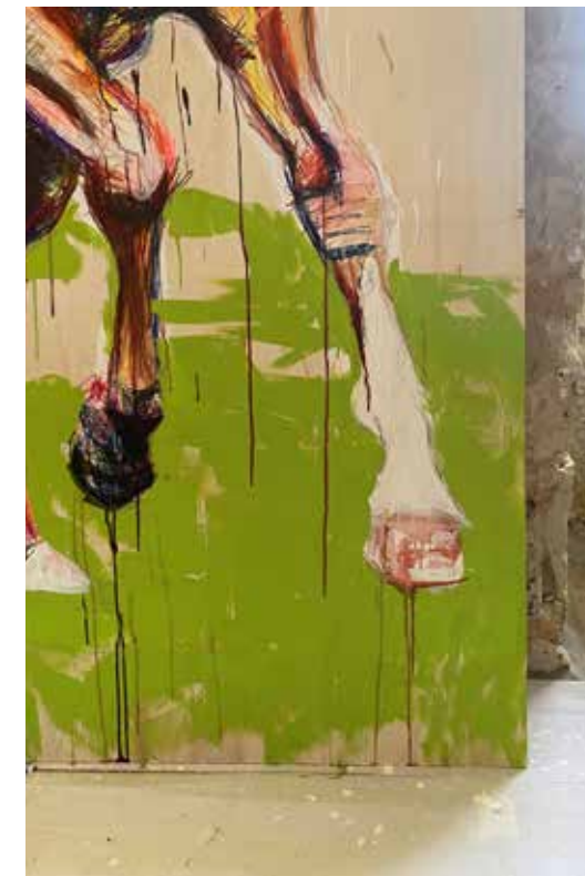
Natural leadership , installation (détail - vue d'atelier) © Emmanuel Morin