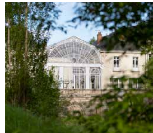
Verrière vue du Thouet