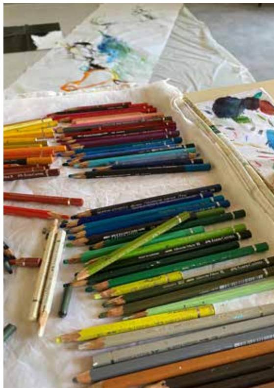
Détail - vue d'atelier