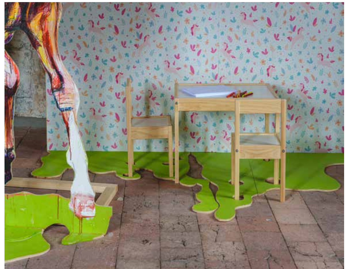
Alfonse, Paul et les autres, Natural leadership , installation (détail - vue d'atelier), dimensions variables, techniques mixtes, Abbaye de Fontevraud, 2022.