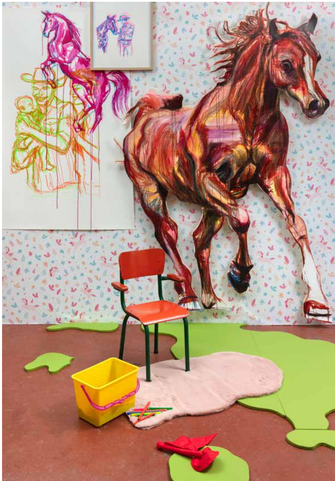
Alfonse, Paul et les autres, Natural leadership , installation, dimensions variables, techniques mixtes, atelier, Forest, 2022.