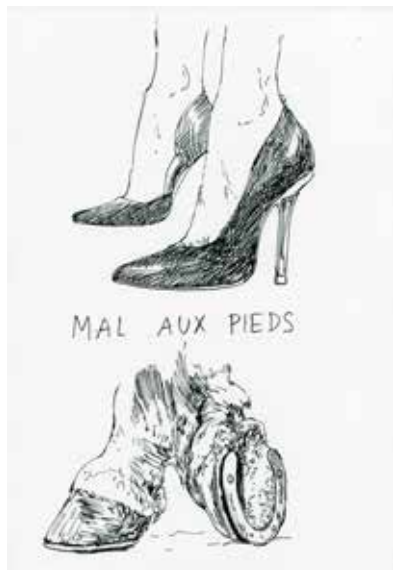
Condition équine © Tereza Lochmann