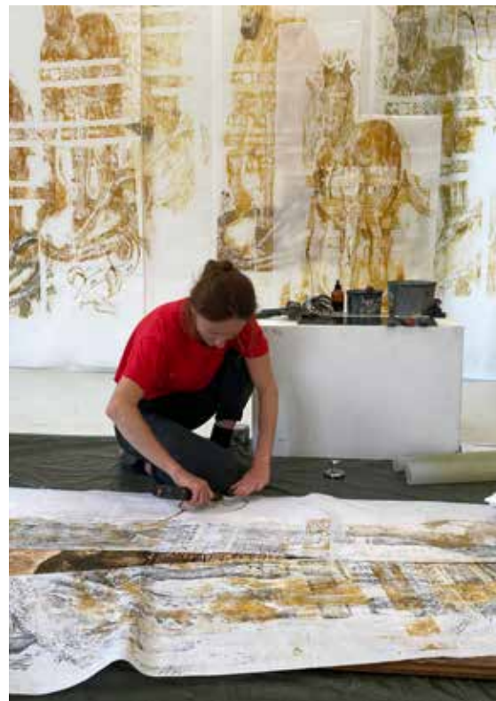
L'Arrivée, réalisation des tirages, photo © Philippe Sohiez