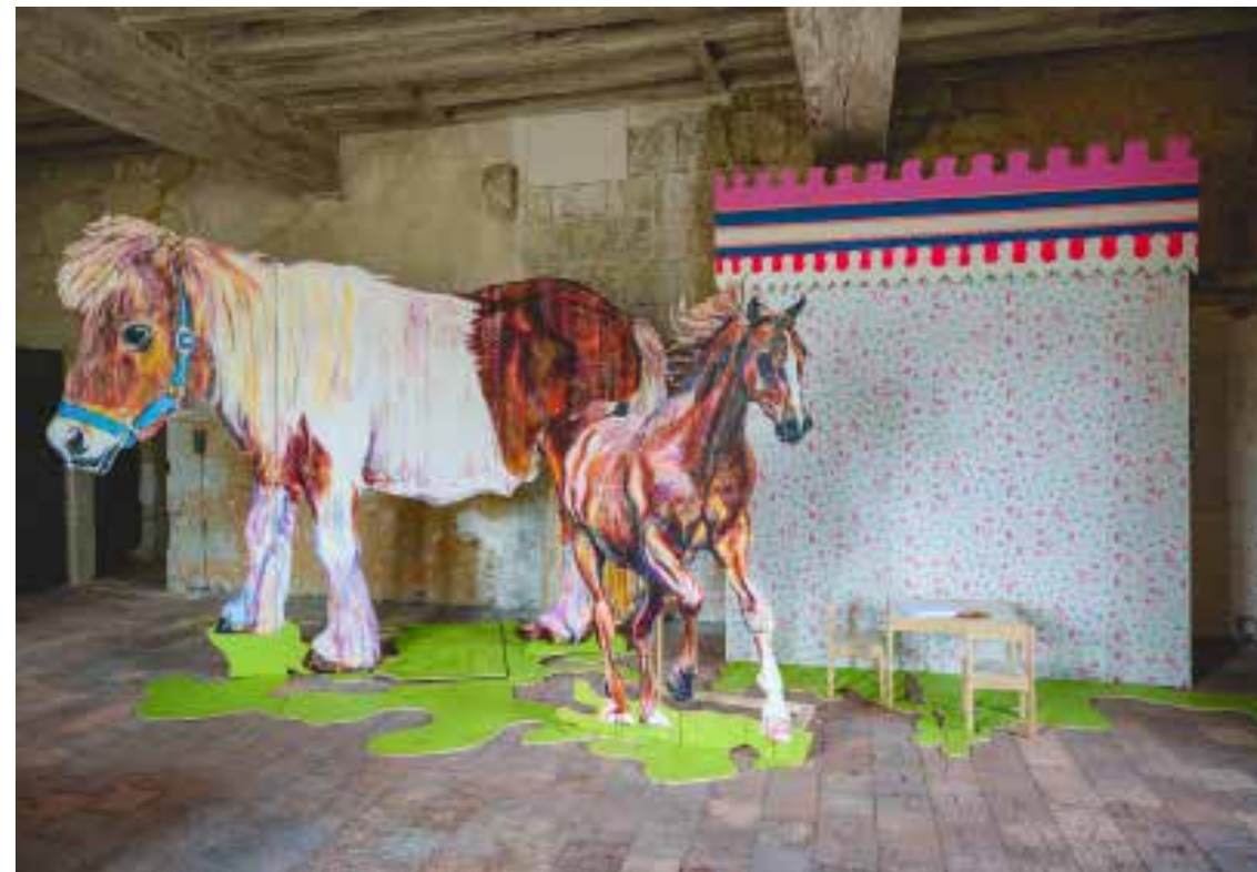
Alfonse, Paul et les autres, Natural leadership, installation (détail - vue d'atelier), dimensions variables, techniques mixtes, Abbaye de Fontevraud, 2022.