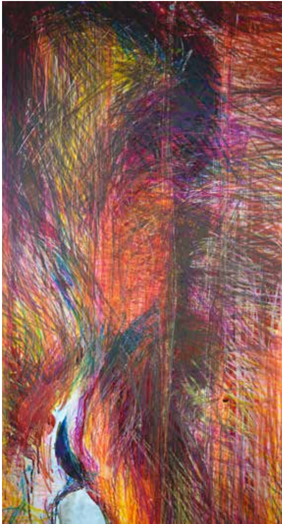
Alfonse, Paul et les autres, Natural leadership , installation (détail - vue d'atelier), dimensions variables, techniques mixtes, Abbaye de Fontevraud, 2022.