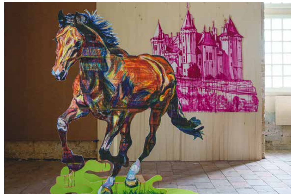
Alfonse, Paul et les autres, Natural leadership , installation (détail - vue d'atelier), dimensions variables, techniques mixtes, Abbaye de Fontevraud, 2022.