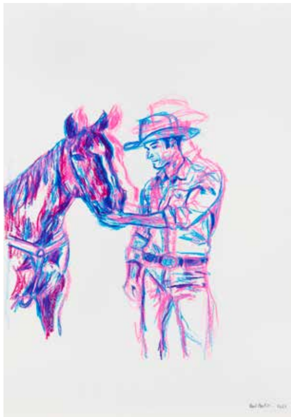
Alfonse, Paul et les autres (attribué à Paul Martin), Sans titre, série Stable things, 48 x 36 cm, crayon de couleur sur papier, 2022.