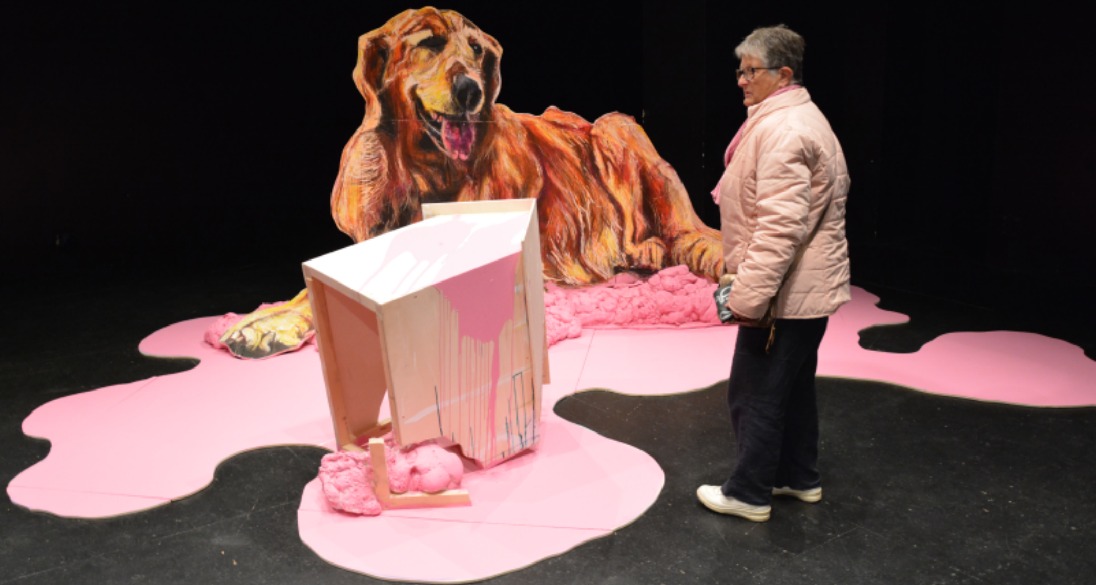
Alfonse, Paul et les autres, Maître chez soi , installation, Nuit Blanche Mayenne 2019, Centre d'art Le Kiosque, commissariat Mathias Courtet. Théâtre de Mayenne (FR).