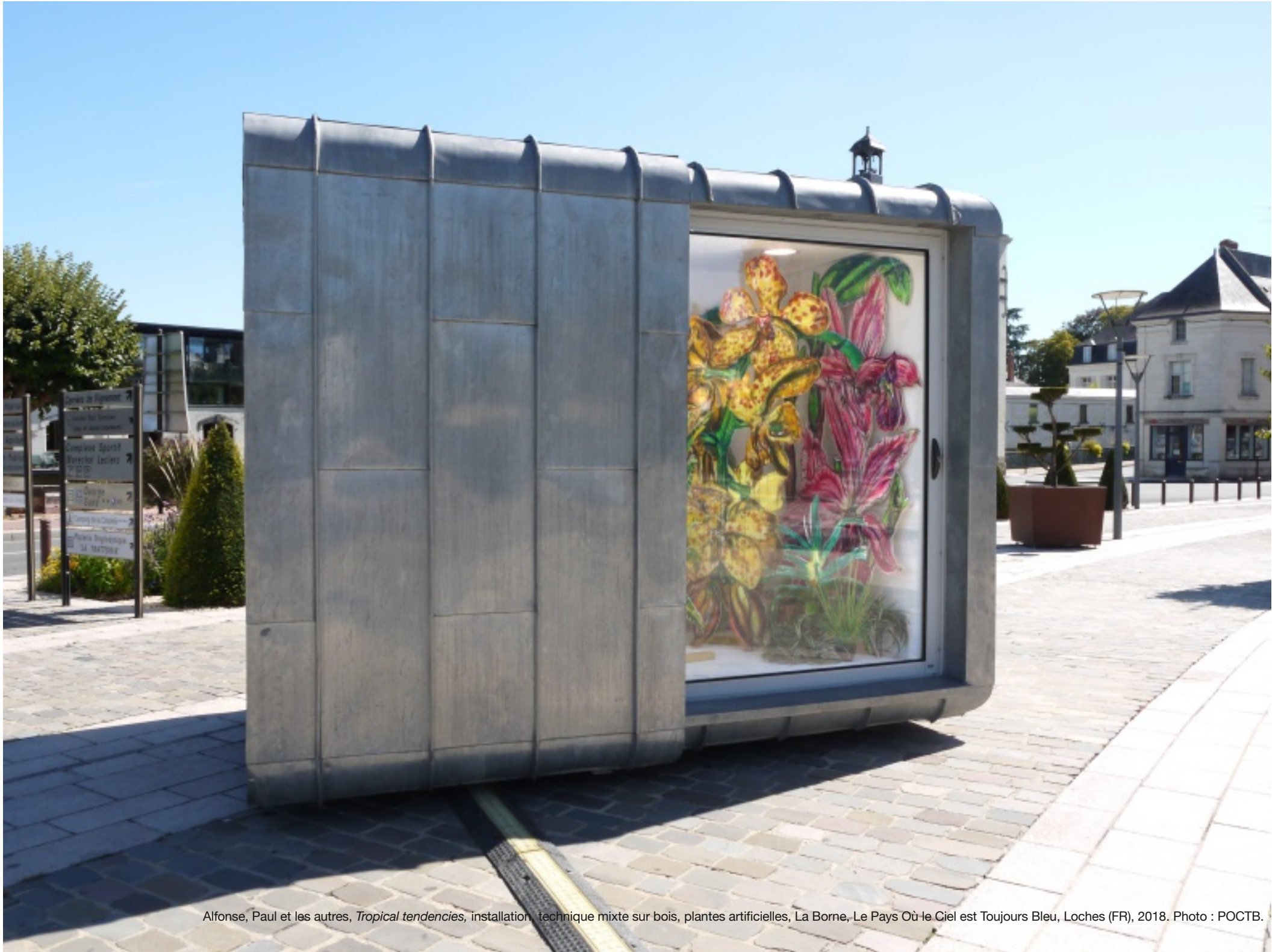
Alfonso, Paul et les autres, Tropical tendencies , installation, technique mixte sur bois, plantes artificielles, La Borne, Le Pays Où le Ciel est Toujours Bleu, Loches (FR), 2018.