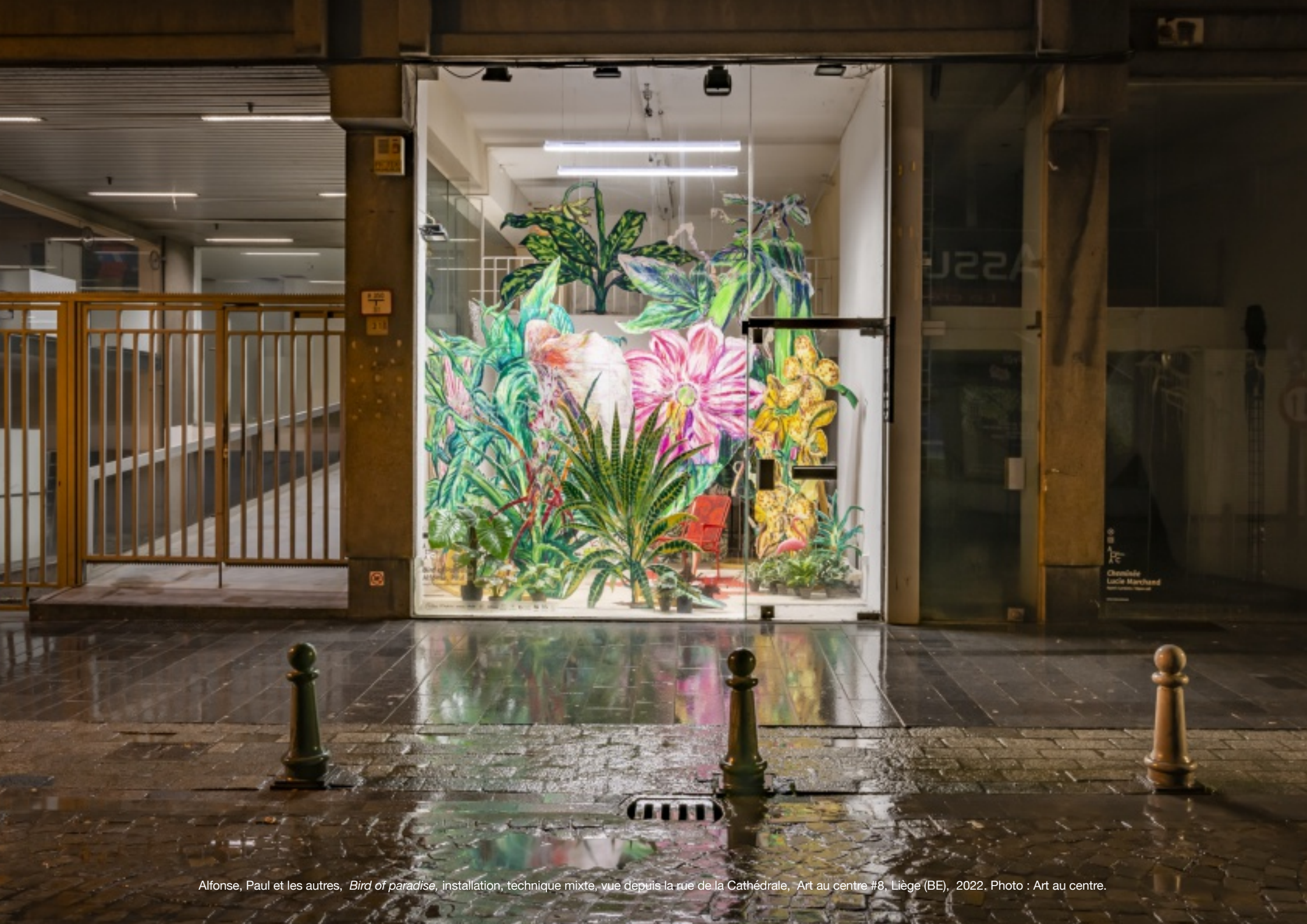
Alfonso, Paul et les autres, Bird of paradise , installation, technique mixte, vue depuis la rue de la Cathédrale, Art au centre #8, Liège (BE), 2022.