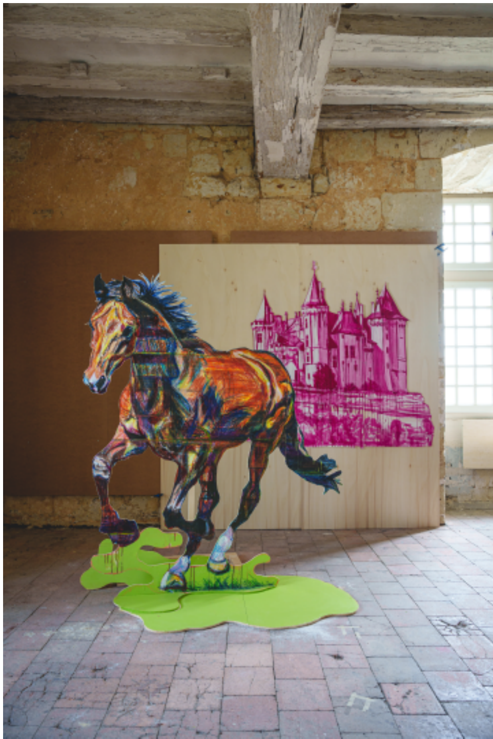
Alfonse, Paul et les autres, Natural leadership , installation (vue d'atelier, détail), technique mixte sur bois, Abbaye Royale de Fontevraud (FR), 2022. Production : Comité équestre de Saumur. Direction artistique : Emmanuel Morin.