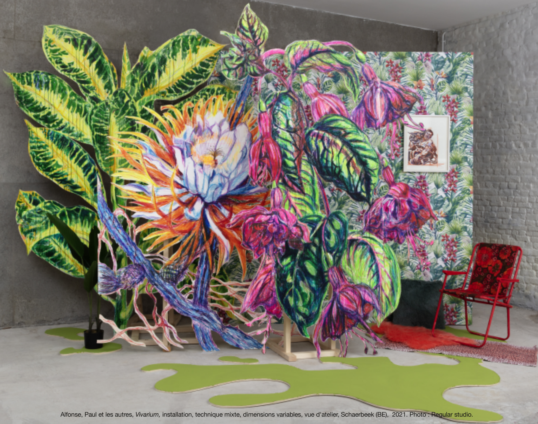
Alfonse, Paul et les autres, Vivarium , installation, technique mixte, dimensions variables, vue d'atelier, Schaerbeek (BE), 2021.