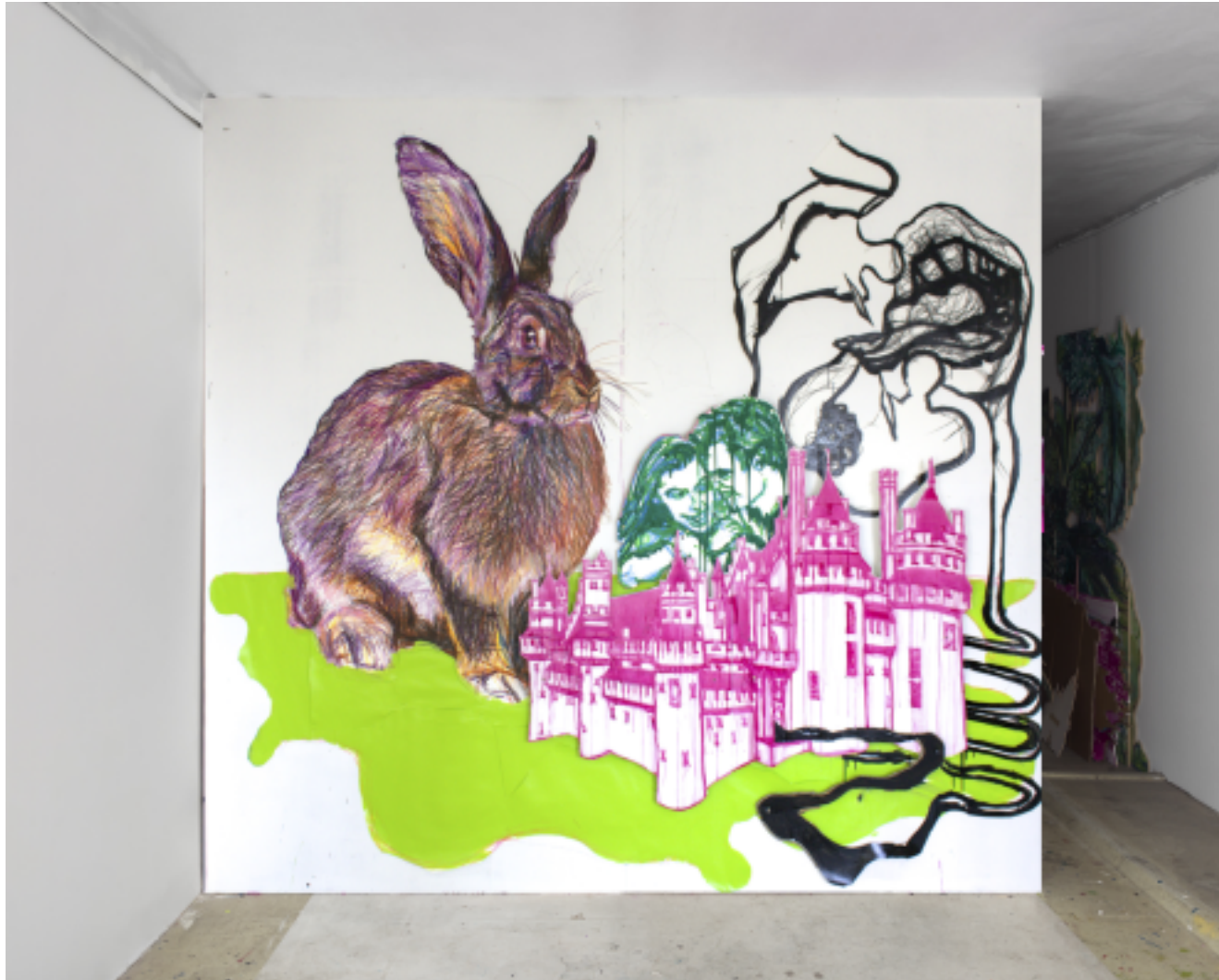
Alfonse, Paul et les autres, Escapade romantique au château de Pierrefonds , technique mixte sur cloison en bois, 223 x 239 cm, atelier, Saint-Gilles (BE), 2020.