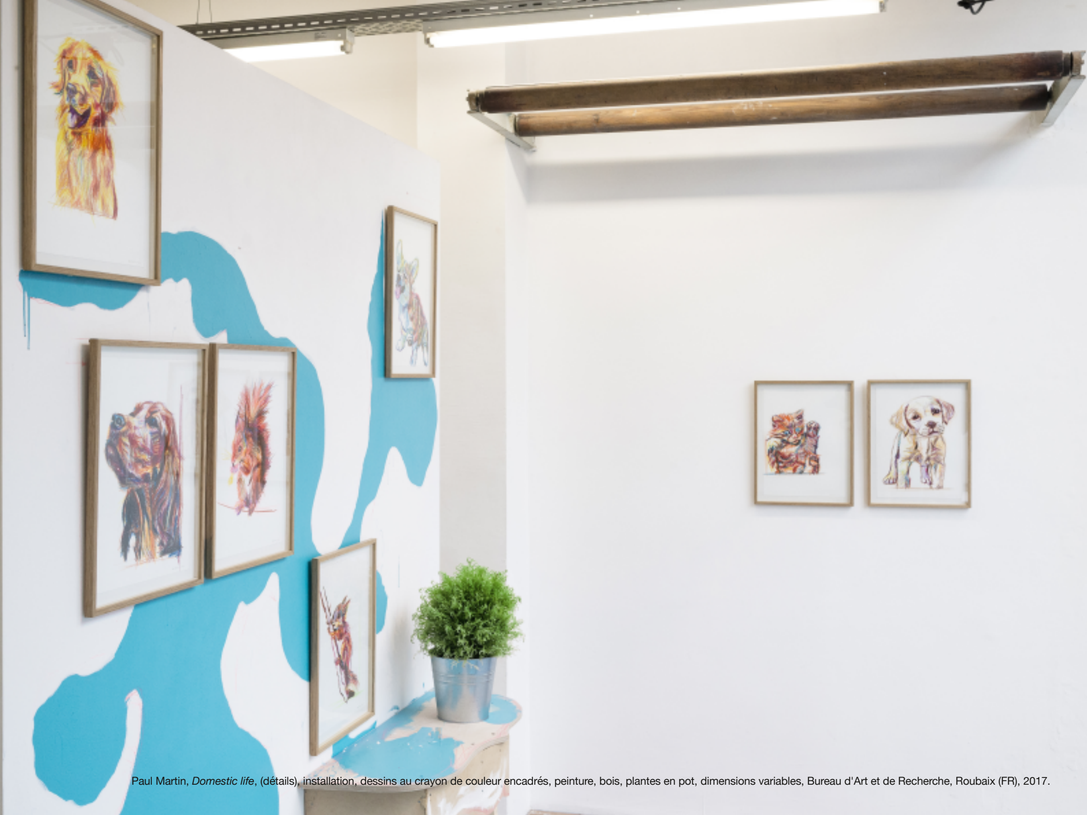
Paul Martin, Domestic life , (détails), installation, dessins au crayon de couleur encadrés, peinture, bois, plantes en pot, dimensions variables, Bureau d'Art et de Recherche, Roubaix (FR), 2017.