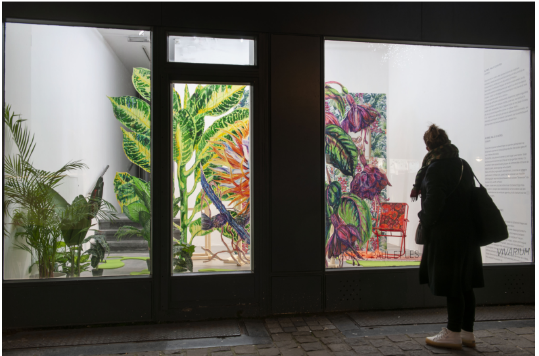
Alfonso, Paul et les autres, Vivarium , installation, technique mixte, dimensions variables, vue depuis la rue Sainte-Catherine, CENTRALE | vitrine, Bruxelles (BE), 2021.