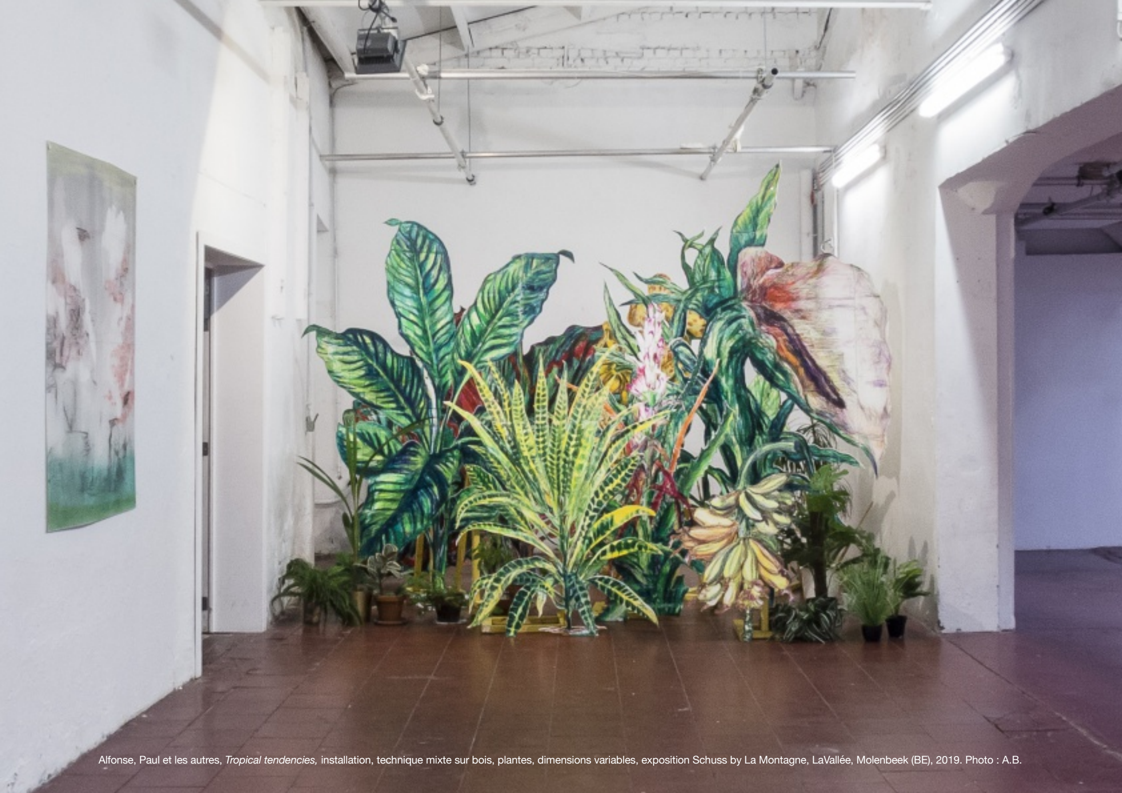
Alfonse, Paul et les autres, Tropical tendencies , installation, technique mixte sur bois, plantes, dimensions variables, exposition Schuss by La Montagne, LaVallée, Molenbeek (BE), 2019.